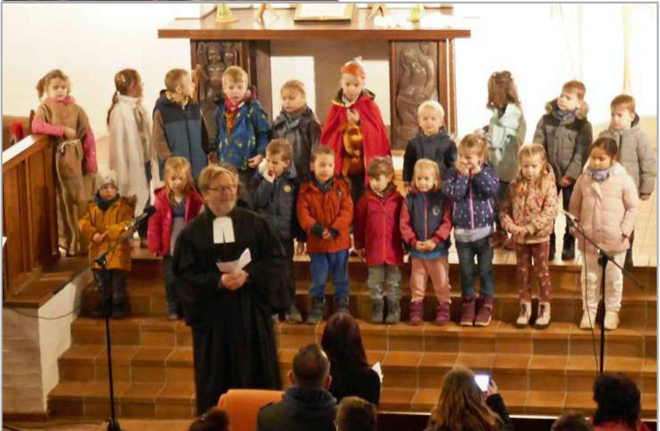
Ökumenische St. Martinsfeier in der Christuskirche, Foto: Thomas Krakowsky