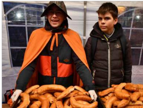
Bei der zentralen ökumenischen Martinsfeier gab es traditionsgemäß Hörnchen, Fotos: Funny Szopny