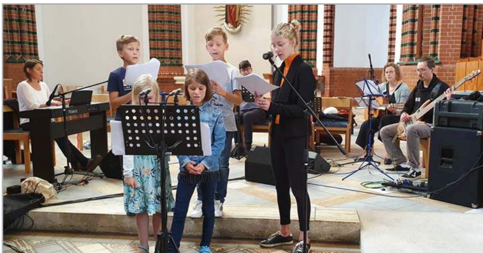
Ein Kinderchor trifft sich seit diesem Schuljahr projektbezogen. Der nächste Gesang ist am 11. Dezember in St. Jakobus.

Zusätzlich werden wieder Kindergottesdienste stattfinden. Hier sind Kinder bis zur 2. Klasse (auch mit ihren Eltern) herzlich zur Kinderkatechese eingeladen. Termine werden zeitnah mitgeteilt.