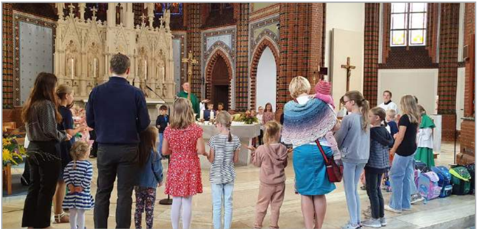
Familiengottesdienst in St. Jakobus

Nun wollen wir aber wieder regelmäßig alle Familien zum Familiengottesdienst einladen. Dieser soll 2023 in der Regel einmal im Monat in der Kathedrale St. Jakobus stattfinden. Zum Familiengottesdienst sind alle herzlich eingeladen: Familien mit kleinen und auch größeren Kindern. Nach dem Gottesdienst wird herzlich zum Kennenlernen, miteinander Reden und gemeinsam eine Kleinigkeit Essen eingeladen. Wer möchte, kann gern etwas zum Essen (Suppe, Brot, Kuchen, etc.) mitbringen.