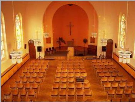
Kirchen der Adventgemeinde, Foto: Stefan Gelke

Adventgemeinde die Hoffnung auf die Wiederkunft Christi betonen, was ihr auch den Namen gab. Ca. 60 Gemeindeglieder finden sich zu den wöchentlichen Gottesdiensten zusammen, die am Sonnabend stattfinden, dem biblischen Sabbat. Der Sabbat ist uns Erinnerung an die Schöpfung, die Zehn Gebote und an das kommende Reich Gottes. Wichtig ist uns die Verantwortung für das eigene Leben. Darum ermutigen wir zu einem gesunden Lebensstil. Wir leben mit unseren Schwestern und Brüdern anderer Kirchen und Gemeinden den Auftrag, den uns Jesus