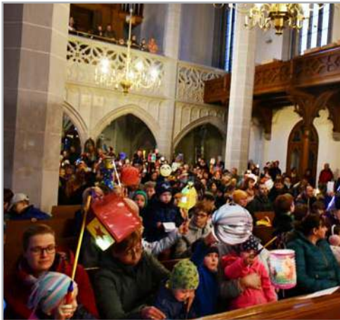
Zentrale ökumenische St. Martinsfeier in der Lutherkirche, Foto: Fanny Szyopny